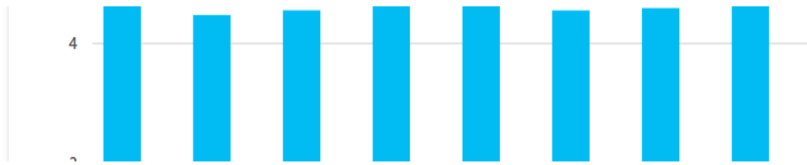
Graf č. 1 – produkce v měsíci osa Y: množství v tunách osa X: měsíc