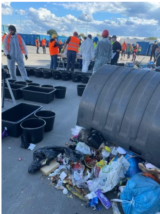
Ilustrační foto č. 4 – provádění rozboru smíšeného komunálního odpadu

Objemný odpad odevzdávají občané na sběrném dvoře, nebo pověřené odborné firmě do přistavených velkoobjemových kontejnerů, a také při mobilním sběru přímo do svozového vozidla podle instrukcí obsluhy. Při přebírání objemného odpadu zajišťuje přebírající obsluha oddělení recyklovatelných složek (minimálně kovů, plastů a dřeva velkých rozměrů). Odborná firma následně zajišťuje další úpravu objemného odpadu s cílem získat z něj využitelné složky, jako například dřevo, plast, kovy, sklo za účelem jejich recyklace, či jej využívá jako složku pro alternativní palivo, nevyužitelný zbytek je obvykle uložen na skládce nebo využit pro výrobu tuhého alternativního paliva, případně je spálen ve spalovně komunálních odpadů.